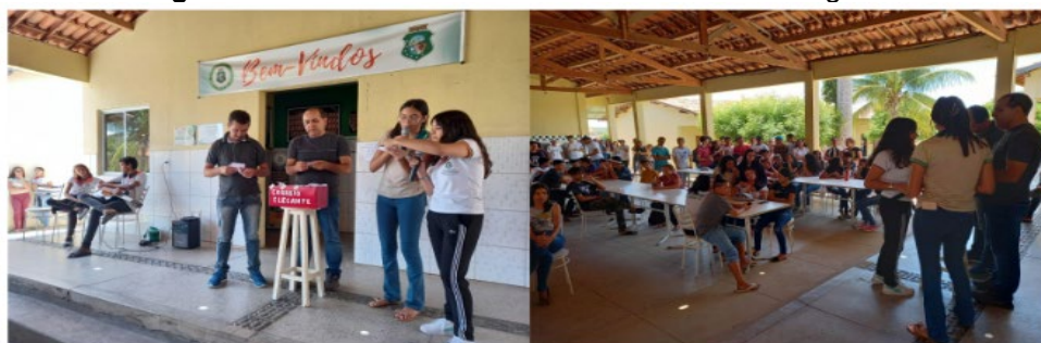
Figura 4 - Atividade recreativa intitulada “Correio Elegante”