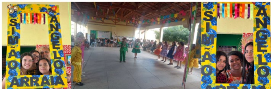
Figura 5 - Evento comemorativo aos festejos juninos