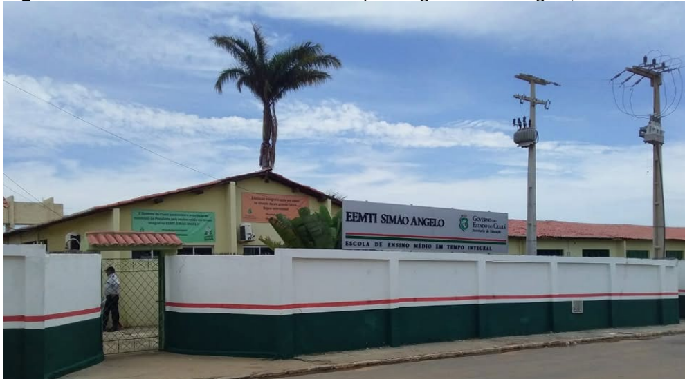
Figura 2 - Escola de Ensino Médio em Tempo Integral Simão Ângelo, Penaforte-CE