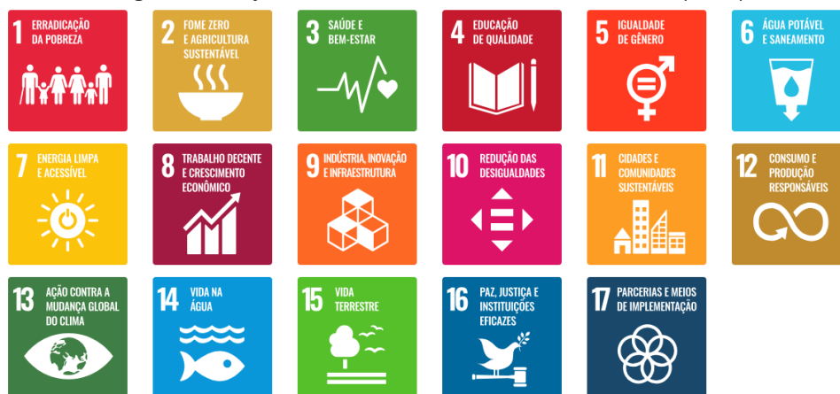
Figura 1 - Objetivos de Desenvolvimento Sustentável (ODS)