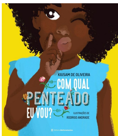
Figura 2 – Capa do livro “Com qual Penteado eu vou?”