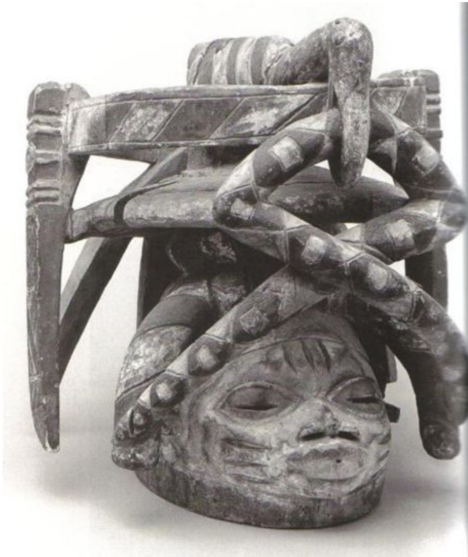
Máscara de Gèlèdé

Aqui os artesãos Yorùbá demonstram os seus talentos únicos para desenvolver e projetar esta complexidade dos poderes femininos através das suas artes.