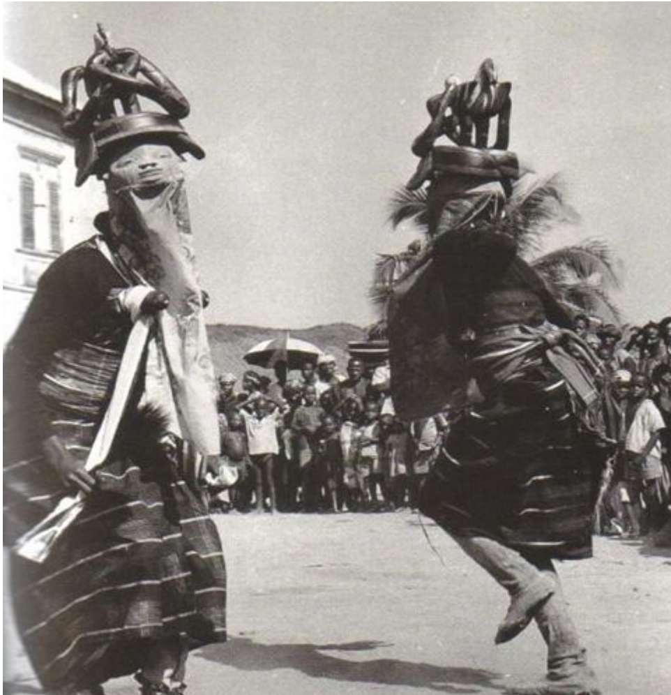
Espectáculo de Gèlèdè (1969)

Devido a estes poderes atribuídos às mulheres, estatuetas poderosas e ritualísticas tem sido criadas para valorizar os órgãos que contribuem para a maternidade. Destaca entre elas, a vagina , também chamada ‘òná òrun’ – o caminho para céu – ‘omú’ – os seios e o ‘ìkunle abiyamo’ o ajoelhar com as dores no dia de dar a luz (Makinde, 2004).