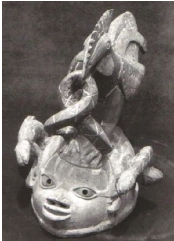
Máscaras de Gèlèdè

Observe que as máscaras sempre mostram uma galinha bicando uma cobra ou vice-versa.