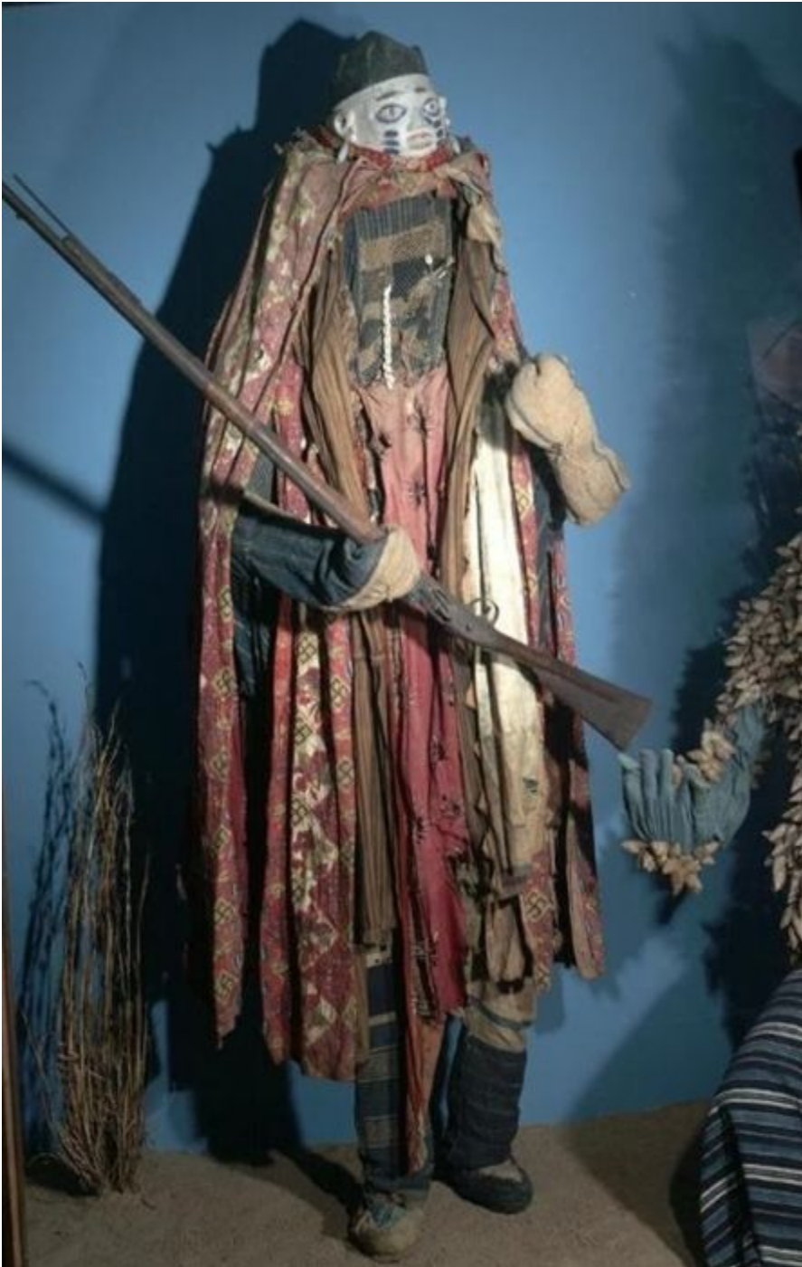
Gèlèdè – Museu de História Natural de Nova York