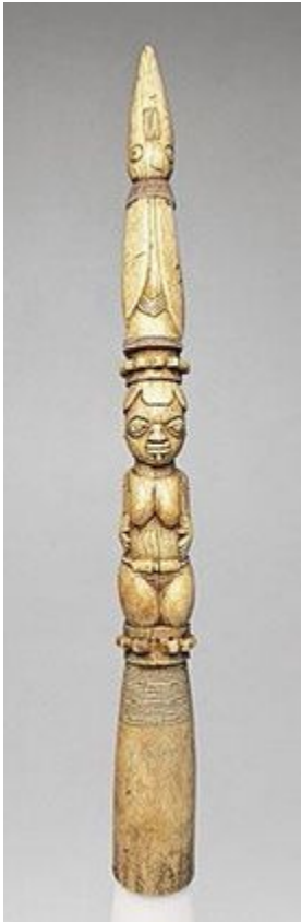
forç. Iroke Ifá

Este festival é sempre o mais cobiçado e o mais animado do ano na sociedade.